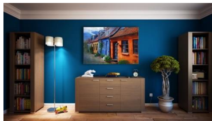
BU: Mit einer professionellen Abdichtung von innen schafft man zusätzlichen Wohnraum im Keller.

Außerdem gibt es Abplatzungen an den Wänden, was ebenfalls auf eine zu hohe Feuchtebelastung hinweist. Da das Raumklima nicht gerade einladend ist, wird der Keller höchstens als Abstellkammer genutzt. Und während oben der Platz eng wird, bleibt der Keller von jeder wohnlichen Nutzung unberührt. Doch eine Aufwertung und Sanierung muss weder aufwendig noch schwierig sein. Zudem schafft sie nicht nur zusätzlichen Wohnraum, sondern schützt auch das Mauerwerk vor der von außen eindringenden Feuchtigkeit. Diese Feuchtigkeit bedroht übrigens nicht nur den Keller: Falls sie nicht daran gehindert wird, kann sie weiter nach oben steigen.